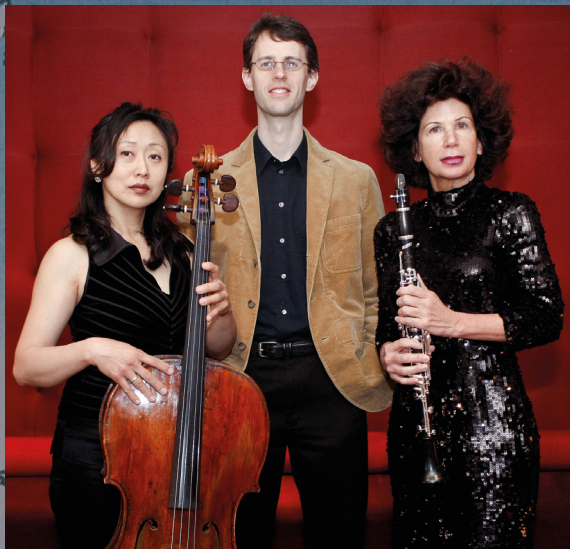
TRIO DI BUSON