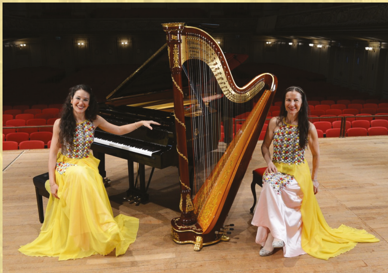
PRAXEDIS & PRAXEDIS